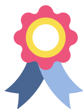
映えるで賞 最もSNS映えしそうな作品