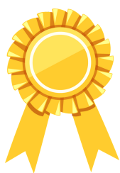
グランプリ 最も響いた作品