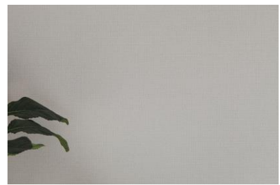
③竹炭ケナフクロス

内装材も、無垢の床、竹炭ケナフクロス、珪藻土、水性塗料など自然素材や調湿効果の高い素材を用いて、夏は湿気を吸収し湿度を下げ、冬は水分を放出することで、体感温度をコントロールし快適な住空間を提案しています。