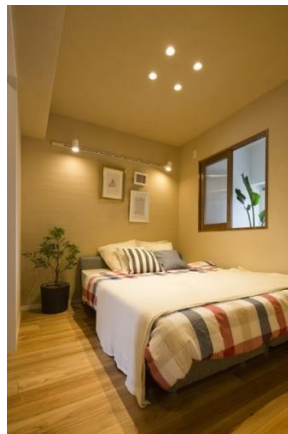
② 部屋窓のあるベッドルーム