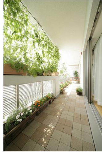
③緑のカーテン (参考写真)

快適な住環境を作るためには外壁面の断熱補強だけでなく、窓そのものの性能アップも重要と考えています。夏の熱の流入、冬の流出を軽減するため、既存サッシの内側に樹脂製サッシ、断熱スクリーンの設置を提案しています。夏場はバルコニーの庇、緑のカーテン (任意)、既存サッシ、樹脂製サッシ、断熱スクリーンの5重構造で熱の流入を防ぎエアコンになるべく頼らない涼しい環境を作りだします。冬場は緑のカーテンを撤去し、日中の陽を取り入れ室内を暖め、夜間は二重サッシ+断熱スクリーンで熱の流出を防ぎます。