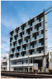
ミュージョンひばりが丘北