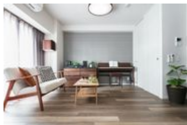
ミュージション門前仲町 1LDKタイプ リビング