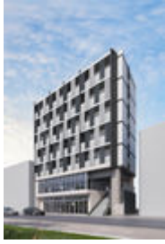
ミュージションひばりが丘北外観イメージ