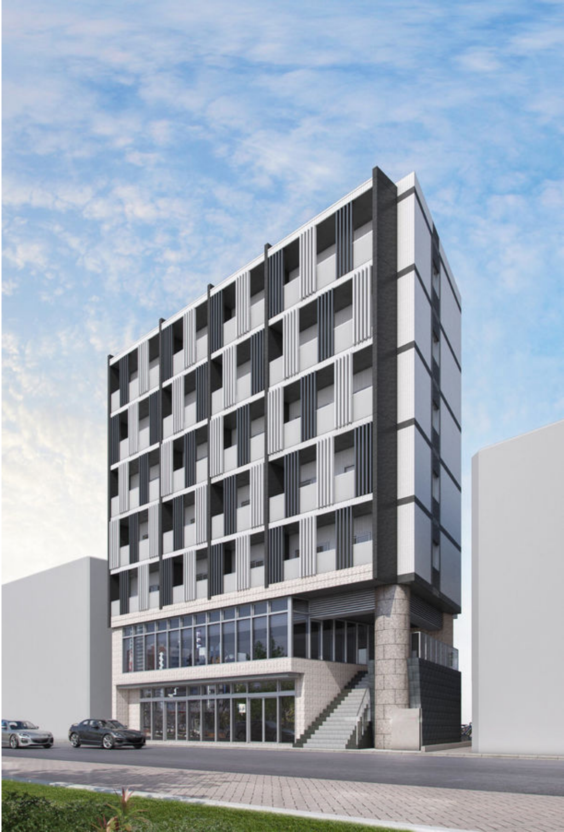
ミュージョンひばりが丘北外観イメージ