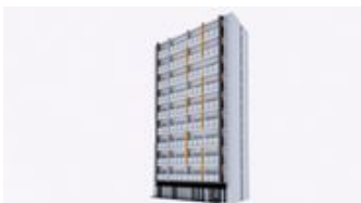
ミュージョン千葉駅前外観イメージ