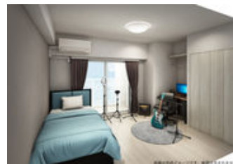
Aタイプ(1K)イメージ図