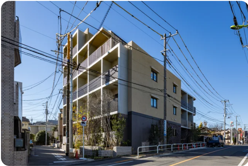
ミュージックplus世田谷経堂外観

所在地 : 東京都世田谷区桜上水一丁目21番14号 構造 : 鉄筋コンクリート造5階建 住宅戸数 : 24戸 (1K/2K/2LDK) 竣工 : 2023年12月 交通 : 小田急線「経堂」駅 徒歩12分、小田急バス「桜上水二丁目」バス停徒歩1分 賃料 : 130,000円～280,000円 管理費 : 6,000円～12,000円 遮音性能 : D-70