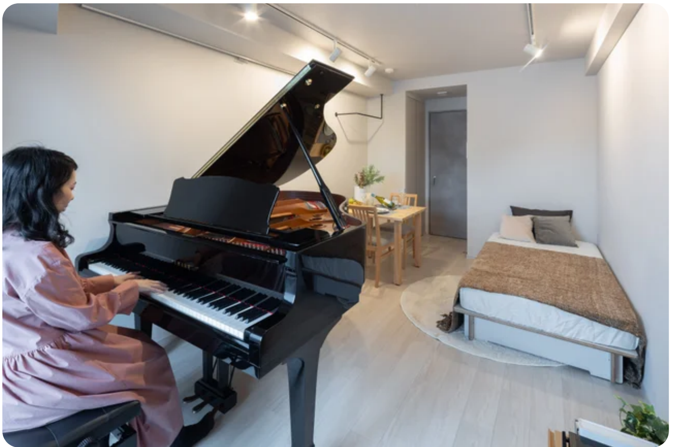
ミュージションplus世田谷経堂Cタイプ（1K）モデルルーム画像

24時間楽器演奏を推奨する防音賃貸住宅「ミュージション」シリーズを手がけるマンションデベロッパーの株式会社リブラン（本社：東京都板橋区、代表取締役社長：渡邊裕介）は、2023年12月に完成した「ミュージションplus世田谷経堂」にて、 第2期入居申込受付